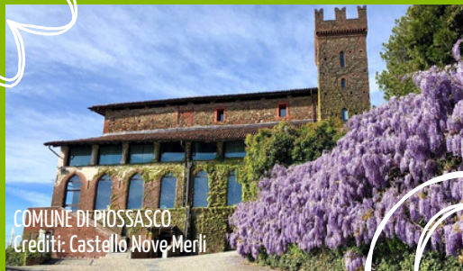
COMUNE DI PIOSSASCO

UN NUOVO APPROCCIO ALL'ECONOMIA CIRCOLARE, PER RENDERE ANCORA PIÙ BELLE E PULITE LE NOSTRE CITTÀ!