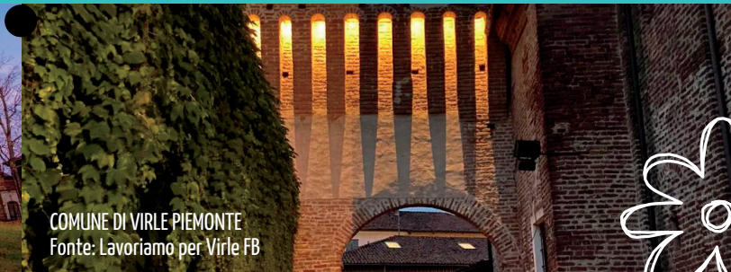
COMUNE DI VIRLE PIEMONTE