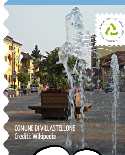
COMUNE DI VILLASTELLONE

WWW.COVAR14 O CHIAMA IL NUMERO VERDE CONSORTILE 800.639.639