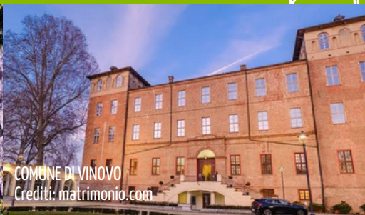
COMUNE DI VINOVO