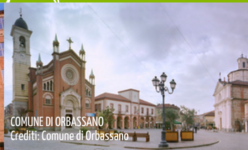
COMUNE DI ORBASSANO