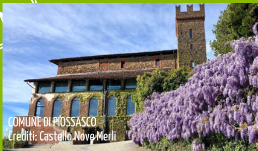
COMUNE DI PIOSASCO

UN NUOVO APPROCCIO ALL'ECONOMIA CIRCOLARE, PER RENDERE ANCORA PIÙ BELLE E PULITE LE NOSTRE CITTÀ!