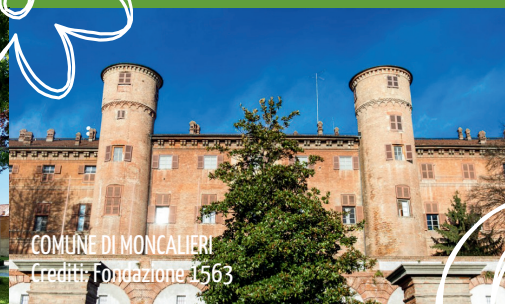
COMUNE DI MONCALIERI