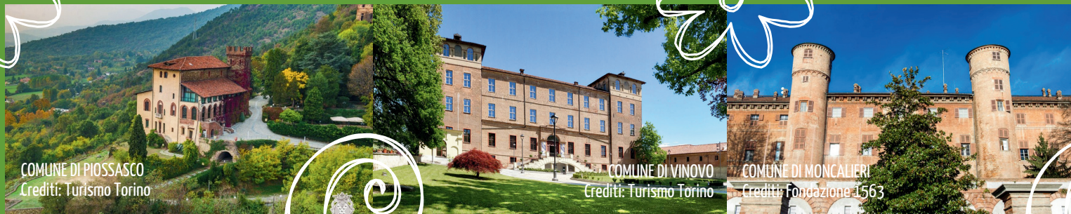
COMUNE DI PIOSASCO

UN NUOVO APPROCCIO ALL'ECONOMIA CIRCOLARE, PER RENDERE ANCORA PIÙ BELLE E PULITE LE NOSTRE CITTÀ!