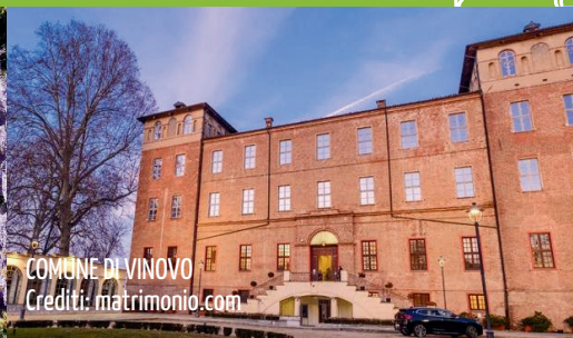
COMUNE DI VINOVO