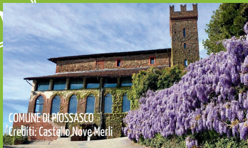
COMUNE DI PIOSASCO Crediti: Castello Nove Merli

UN NUOVO APPROCCIO ALL'ECONOMIA CIRCOLARE, PER RENDERE ANCORA PIÙ BELLE E PULITE LE NOSTRE CITTÀ!