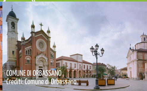
COMUNE DI ORBASSANO